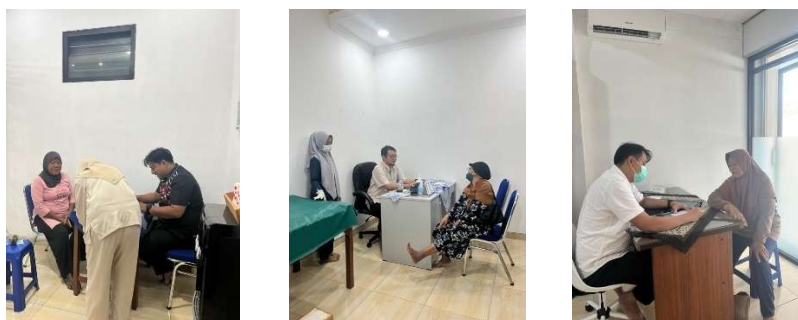
Gambar 5. Ruang Pemeriksaan Dokter

Setelah peserta menjalani pemeriksaan oleh dokter umum maupun dokter spesialis, kegiatan dilanjutkan dengan persiapan obat sesuai resep yang diberikan oleh dokter (Gambar 6). Tim farmasi bertugas menyiapkan obat-obatan secara teliti dan cermat, berdasarkan diagnosis serta terapi yang telah ditentukan oleh masing-masing dokter. Obat disiapkan dengan memperhatikan dosis, frekuensi, dan cara penggunaan yang tepat sesuai standar pelayanan kefarmasian. Kegiatan ini tidak hanya bersifat kuratif, tetapi juga mengutamakan aspek keamanan dan rasionalitas penggunaan obat, terutama mengingat sebagian besar peserta adalah lansia yang memiliki risiko tinggi terhadap interaksi obat maupun efek samping. Selain menyampaikan informasi secara lisan, apoteker juga memberikan etiket obat untuk memudahkan pasien dan keluarga dalam memahami petunjuk penggunaan di rumah.