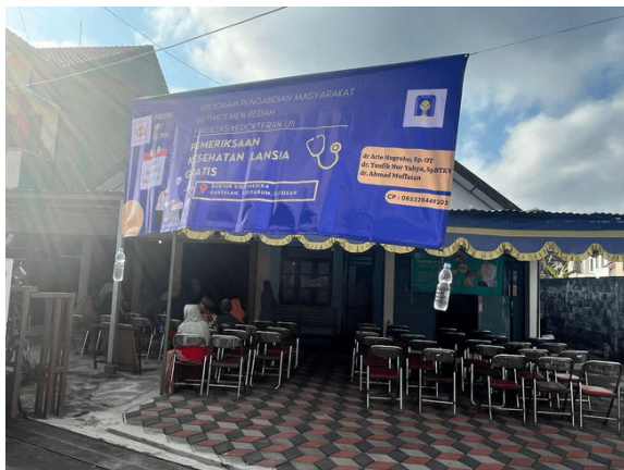
Gambar 3. Lokasi Pelaksanaan Kegiatan

Kegiatan diawali dengan proses registrasi awal peserta, di mana para lansia yang hadir didata secara administratif untuk keperluan pencatatan dan pelaporan. Setelah proses registrasi selesai, peserta kemudian menjalani skrining awal yang bertujuan untuk mengetahui kondisi kesehatan umum serta riwayat penyakit yang pernah atau sedang diderita. Tahapan selanjutnya adalah pemeriksaan vital sign yang meliputi pengukuran tekanan darah, suhu tubuh, denyut nadi, dan laju pernapasan (Amalia et al. 2022). Pemeriksaan ini dilakukan oleh tenaga kesehatan guna mendapatkan gambaran awal status kesehatan peserta sebelum melanjutkan ke pemeriksaan lanjutan oleh dokter umum maupun spesialis. Proses ini juga menjadi langkah penting dalam mengidentifikasi kondisi-kondisi yang memerlukan perhatian medis lebih lanjut secara cepat dan tepat (Gambar 4).