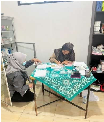
Gambar 7. Proses Penyerahan dan Edukasi Obat