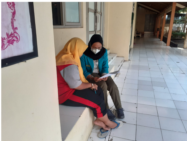
Gambar 2. Kegiatan Presentasi Poster Madding