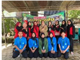
gambar 15 pendampingan posyandu

Senam merupakan kegiatan yang bermanfaat untuk meningkatkan kelincuhan tubuh, meningkatkan keluwesan tubuh, menjaga tubuh tetap ideal, sehat dan bugar. Menyehatkan jantung dan paru-paru. Kegiatan ini diselenggarakan pada tanggal 18 Februari 2024 bertempat di lapangan voli. Senam bersama ini berkolaborasi dengan KKN UPY dan dibantu oleh Karang taruna giriloyo. Kurangnya partisipasi masyarakat dusun Giriloyo untuk senam pagi Bersama dikarenakan warga dusun Giriloyo sebagian bekerja. Keberhasilan kegiatan ini bisa dilihat dari partisipasi dan antusias sebagian warga dusun Giriloyo yaitu ibu-ibu dan remaja karang taruna yang hadir dalam kegiatan ini.