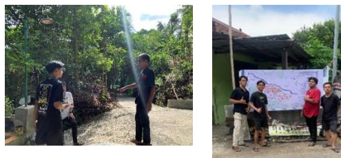
gambar 18 observasi & pemasangan PETA

Peta administrasi pada dasarnya merupakan suatu data teknis dalam suatu kelurahan/desa yang penting dan diperlukan untuk mengetahui letak dan batas suatu wilayah secara geografis sehingga mempermudah dalam mendapatkan informasi suatu daerah. Pembuatan peta administrasi dusun menjadi langkah penting dalam upaya mengorganisir dan mengelola wilayah secara terpadu. Faktor pendukung dalam pembuatan peta ini adalah belum adanya peta padukuhan yang lebih terperinci di dusun Giriloyo. Namun terdapat kendala yaitu sulitnya mencari batas wilayah dusun Giriloyo dikarenakan kebanyakan wilayahnya adalah hutan dan aksesnya yang cukup susah. Hasil yang dicapai Dengan adanya peta padukuhan di Giriloyo, pemerintah dapat memberikan sarana informasi terkait wilayah dusun Giriloyo.