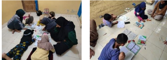
gambar 17 kegiatan bimbel

Bimbingan belajar merupakan aktivitas belajar tambahan yang diberikan kepada anak-anak untuk menambah pengetahuan. Ilmu yang sekiranya belum didapat atau belum diajarkan di sekolah dengan mengikuti bimbingan belajar anak mampu berprestasi di sekolah. Kegiatan ini diadakan setiap rabu, sabtu dan minggu. Semangat anak-anak untuk belajar dan mengerjakan PR dari sekolah. Hasil yang dicapai Anak-anak terbantu untuk mengerjakan tugas dari sekolah.