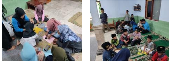
gambar 11 kegiatan pembuatan celengan

sangat mendukung serta anak-anak sangat antusias dalam mengikuti kegiatan Kreatifitas pembuatan celengan. Namun kurangnya alat untuk pembuatan celengan sehingga memakan waktu yang lama dikarenakan banyaknya antusiasme peserta yang mengikuti. Hasil yang dicapai Anak-anak paham tentang pentingnya menabung sejak usia dini, ditambah dengan praktek langsung membuat celengan juga akan menambah minat mereka dalam menabung.