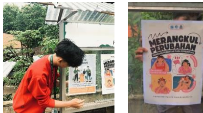
gambar 7 penempelan poster

kenakalan remaja serta Upaya mencegahnya. Dengan tersedianya mading di berbagai tempat proses penempelan poster kenakalan remaja dapat berjalan dengan lancar. Akan tetapi dalam penempelannya hanya di satu titik dikarenakan Masyarakat sering melewati jalan tersebut, Dengan adanya poster tersebut anak-anak berminat untuk membaca dan dapat di terapkan di kehidupan sehari-hari.