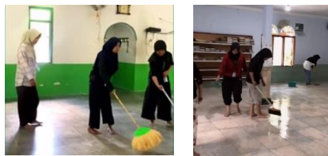
gambar 6 pemberdayaan mushola

Kegiatan pemberdayaan Mushola ini dilakukan pada tanggal 13 Februari 2024 dan 1 Maret 2024. Kegiatan ini yaitu pembersihan secara total Mushola Al-Wustho dan An-Nur serta pemberian alat-alat kebersihan. Pemberdayaan ini dilaksanakan oleh anggota kelompok kkn dan mendapat dukungan dari pengurus mushola. Namun dalam kegiatan ini memiliki kendala seperti keterbatasan alat-alat kebersihan sehingga dalam pembersihan mushola memakan waktu yang cukup banyak. Hasil yang dapat dicapai yaitu penyediaan alat kebersihan yang memadai serta peningkatan kebersihan dan kenyamanan tempat ibadah.