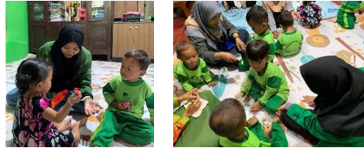
gambar 9 pendampingan PAUD

pelatihan senam, belajar mengenal agama, menggambar, dan lain sebagainya. Namun kurangnya minat orang tua anak pada PAUD menyebabkan minimnya siswa karena ruang belajar yang kurang memadai. Hasil yang dicapai adalah penambahan fasilitas PAUD berupa pengadaan alat menggambar.