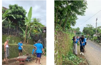
gambar 5 kerja bakti

alat kebersihan sehingga proses kerja bakti kurang optimal. Sehingga hasil yang dicapai lingkungan dusun Giriloyo menjadi lebih bersih dan masyarakat menjadi nyaman dalam beraktifitas sehari-hari (Rahayu dkk., 2022; Rahman & Kuncoro, 2022).