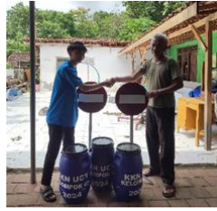
gambar 3 penyerahan tong sampah

sampah (Laksmadita dkk., 2022; Megariska & Sukmana, 2022; Warong dkk., 2024). Dengan adanya pengadaan tong sampah tambahan, masyarakat diharapkan dapat lebih peka terhadap kebersihan lingkungan.