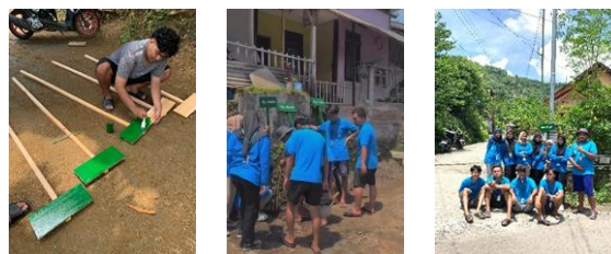
gambar 12 proses pembuatan & pemasangan plang

Pengadaan plang gang merupakan salah satu upaya kami dalam meningkatkan fasilitas umum di dusun Giriloyo yang harapannya akan memudahkan Masyarakat atau pengunjung dalam mencari alamat rumah di dusun Giriloyo. Masyarakat sangat mendukung akan adanya pengadaan plang nama gang yang dimana akan membantu dalam penentuan detail Alamat rumah warga Masyarakat Giriloyo. Akan tetapi proses pembuatan plang yang membutuhkan waktu yang cukup lama serta pemasangan plang yang cukup memerlukan tenaga. Hasil yang dicapai Masyarakat merasa sangat terbantu dengan adanya pengadaan plang nama gang di beberapa jalan utama dusun sehingga memudahkan dalam menentukan alamat pasti rumah warga.