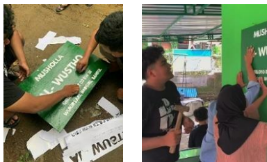
gambar 4 pembuatan dan pemasangan

Pembuatan papan nama mushola di Giriloyo ini merupakan saran serta dukungan dari ketua RT sekaligus pengurus musholah Al Wustho. Tujuan dari pemasangan papan nama ini agar masyarakat sekitar maupun wisatawan yang sedang berkunjung di dusun Giriloyo dapat beribadah di tempat tersebut. Akan tetapi pada saat pembuatan juga memiliki beberapa kendala kecil yaitu pada proses pembuatan papan nama serta bahan yang digunakan tersebut sulit ditemukan. Proses pemasangan papan nama mushola ini terdapat partisipasi Mahasiswa juga dibantu oleh masyarakat didesa tersebut.