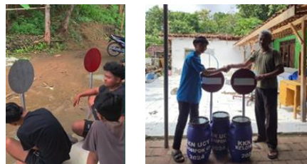
gambar 2 pembuatan dan penyerahan

Program ini merupakan salah satu saran dari masyarakat RT 03, akan tetapi dalam pencarian bahan dan proses pembuatan plang membutuhkan waktu yang cukup lama. Tujuan adanya plang penunjuk arah yaitu untuk memudahkan Masyarakat mengetahui apabila jalan tersebut ditutup. Pembuatan plang ini dilakukan oleh seluruh anggota kkn