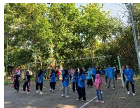
gambar 16 senam bersama warga giriloyo