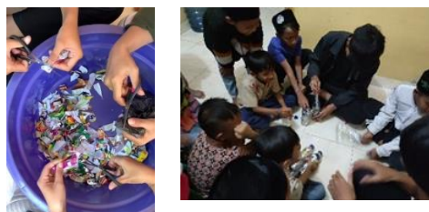
gambar 14 proses pembuatan & sosialisasi ecobrik

Kegiatan ini merupakan salah satu kegiatan untuk meningkatkan kesadaran anak-anak bahwa sampah plastik dan botol bekas bisa dimanfaatkan menjadi barang yang bermanfaat. Keingintahuan anak-anak dalam memanfaatkan sampah plastik yang biasanya mereka buang menjadi ecobrick. Hasil yang dicapai Anak-anak di padukuhan giriloyo adalah menjadi teredukasi bahwa sampah plastik dan botol bekas juga dapat dimanfaatkan menjadi sesuatu yang bermanfaat.