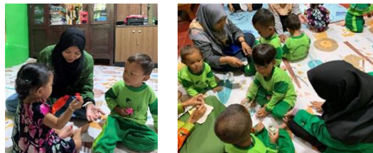
gambar 9 pendampingan PAUD

Kegiatan pendampingan PAUD ini dilaksanakan setiap hari rabu dan jumat. Semua anggota KKN ikut berpartisipasi dalam kegiatan pendampingan PAUD ini. Materi yang di ajarkan sesuai dengan materi yang di berikan oleh guru di PAUD. Seperti kunjungan perpustakaan, pelatihan senam, belajar mengenal agama, menggambar, dan lain sebagainya. Namun kurangnya minat orang tua anak pada PAUD menyebabkan minimnya siswa karena ruang belajar yang kurang memadai. Hasil yang dicapai adalah penambahan fasilitas PAUD berupa pengadaan alat menggambar.