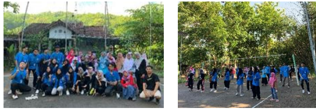
gambar 16 senam bersama warga giriloyo

warga dusun Giriloyo yaitu ibu-ibu dan remaja karang taruna yang hadir dalam kegiatan ini.