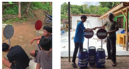
gambar 2 pembuatan dan penyerahan

Program ini merupakan salah satu saran dari masyarakat RT 03, akan tetapi dalam pencarian bahan dan proses pembuatan plang membutuhkan waktu yang cukup lama. Tujuan adanya plang penunjuk arah yaitu untuk memudahkan Masyarakat mengetahui apabila jalan tersebut ditutup. Pembuatan plang ini dilakukan oleh seluruh anggota kkn