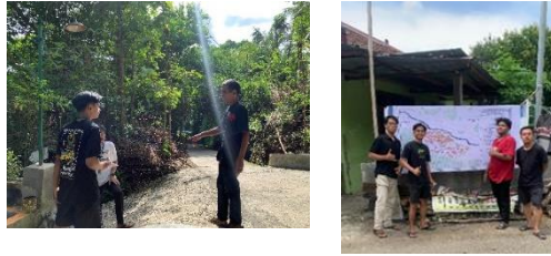
gambar 18 observasi & pemasangan PETA

Dengan adanya peta padukuhan di Giriloyo, pemerintah dapat memberikan sarana informasi terkait wilayah dusun Giriloyo.