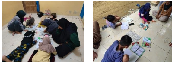
gambar 17 kegiatan bimbel

Bimbingan belajar merupakan aktivitas belajar tambahan yang diberikan kepada anak-anak untuk menambah pengetahuan. Ilmu yang sekiranya belum didapat atau belum diajarkan di sekolah dengan mengikuti bimbingan belajar anak mampu berprestasi di sekolah. Kegiatan ini diadakan setiap rabu, sabtu dan minggu. Semangat anak-anak untuk belajar dan mengerjakan PR dari sekolah. Hasil yang dicapai Anak-anak terbantu untuk mengerjakan tugas dari sekolah.