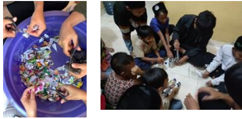
gambar 14 proses pembuatan & sosialisasi ecobrik