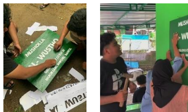
gambar 4 pembuatan dan pemasangan

Pembuatan papan nama mushola di Giriloyo ini merupakan saran serta dukungan dari ketua RT sekaligus pengurus musholah Al Wustho. Tujuan dari pemasangan papan nama ini agar masyarakat sekitar maupun wisatawan yang sedang berkunjung di dusun Giriloyo dapat beribadah di tempat tersebut. Akan tetapi pada saat pembuatan juga memiliki beberapa kendala kecil yaitu pada proses pembuatan papan nama serta bahan yang digunakan tersebut sulit ditemukan. Proses pemasangan papan nama mushola ini terdapat partisipasi Mahasiswa juga dibantu oleh masyarakat didesa tersebut.