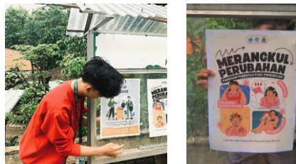
gambar 7 penempelan poster

Penempelan poster kenakalan remaja dilaksanakan pada tanggal 2 maret 2024. Tujuan dari penempelan poster untuk memberikan pemahaman kepada remaja tentang dampak negatif dari perilaku kenakalan remaja serta Upaya mencegahnya. Dengan tersedianya mading di berbagai tempat proses penempelan poster kenakalan remaja dapat berjalan dengan lancar. Akan tetapi dalam penempelannya hanya di satu titik dikarenakan Masyarakat sering melewati jalan tersebut, Dengan adanya poster tersebut anak-anak berminat untuk membaca dan dapat di terapkan di kehidupan sehari-hari.