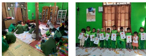
gambar 8 kegiatan mewarnai

Kegiatan mewarnai ini bertujuan untuk memperkenalkan warna, hewan dan buah kepada anak-anak. Kegiatan ini dilaksanakan pada tanggal 5 Maret 2024 bertempat di PAUD SPS Sanggar Pintar. Dengan adanya pendampingan PAUD ini Guru PAUD sangat mendukung dan terbantu dalam proses kegiatan belajar anak-anak. Namun kurangnya minat orang tua anak pada PAUD menyebabkan minimnya siswa karena ruang belajar yang kurang memadai. Hasil yang dicapai adalah penambahan fasilitas PAUD berupa pengadaan alat menggambar.