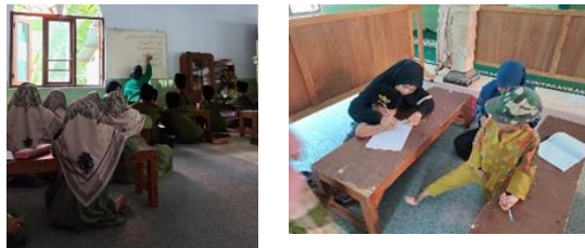
gambar 13 kegiatan BTA

Tujuan kegiatan ini adalah memperkenalkan huruf hijaiyah kepada anak-anak serta belajar menulis dan membaca Al Quran. Pelaksanaan kegiatan BTA ini menyesuaikan jadwal TPA yaitu setiap hari selasa dan sabtu. Pengurus TPA sangat mendukung dengan adanya pendampingan BTA dan anak-anak antusias dalam mengikuti pembelajaran. Akan tetapi terdapat hambatan dari kegiatan BTA ini yaitu kurang kondusifnya anak-anak ketika pembelajaran dimulai. Hasil yang dicapai dari kegiatan Baca Tulis Al Quran adalah anak-anak sejak usia dini sudah mengenal huruf hijaiyah serta belajar membaca dan menulis arab.