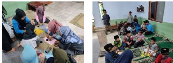
gambar 11 kegiatan pembuatan celengan

Pembuatan celengan ini berbahan dasar botol plastik bekas. Dalam kegiatan ini dilakukan secara langsung di mushola yang diikuti oleh anak-anak TPA. Proker ini dilaksanakan pada tanggal 27 Februari 2024, pada pukul 15.00-18.00 WIB bertempat di Mushola An-Nur. Pengurus TPA sangat mendukung serta anak-anak sangat antusias dalam mengikuti kegiatan Kreatifitas pembuatan celengan. Namun kurangnya alat untuk pembuatan celengan sehingga memakan waktu yang lama dikarenakan banyaknya antusiasme peserta yang mengikuti. Hasil yang dicapai Anak-anak paham tentang pentingnya menabung sejak usia dini, ditambah dengan praktek langsung membuat celengan juga akan menambah minat mereka dalam menabung.