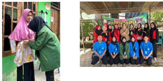
gambar 15 pendampingan posyandu

Posyandu (pos pelayanan terpadu) dilaksanakan satu kali dalam sebulan, yang bertujuan untuk mencegah peningkatan angka kematian ibu dan bayi saat kehamilan, persalinan, atau setelahnya melalui pemberdayaan masyarakat. Kegiatan ini dilakukan pada tanggal 11 Februari 2024. Dukungan yang didapatkan adalah dukungan sosial, motivasi, rasa tanggungjawab dan jumlah kader yang bertugas. Namun, Kesadaran masyarakat yang kurang mengenai program posyandu terlihat dari kunjungan bayi ke posyandu. Hasil yang dicapai kader posyandu terbantu dengan adanya kita dalam kegiatan posyandu.