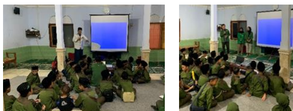
gambar 10 sosialisasi menabung

Sosialisasi tentang pentingnya menabung sejak dini telah dilakukan sebagai bagian dari upaya pendidikan keuangan bagi generasi muda. Kegiatan sosialisasi ini dilakukan pada tanggal 24 Februari 2024 dimulai pada pukul 16.00-17.00 WIB bertempat di Mushola An-Nur, dengan sasaran anak-anak TPA. Pengurus TPA sangat mendukung serta anak-anak antusias mengikuti sosialisasi. Namun adanya keterbatasan waktu sehingga materi belum tersampaikan secara menyeluruh. Hasil dari kegiatan sosialisasi menabung ini adalah anak-anak bisa mengerti akan pentingnya menabung sejak usia dini dengan cara menyisihkan uang saku dan berhemat dalam membelanjakan uang saku mereka.