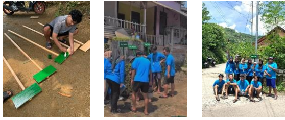
gambar 12 proses pembuatan & pemasangan plang