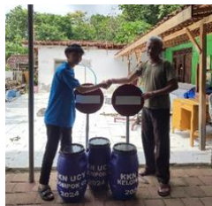
gambar 3 penyerahan tong sampah

Pengadaan tong sampah ini dilaksanakan pada tanggal 05 Maret 2024, masyarakat sekitar sangat mendukung adanya pengadaan tong sampah tambahan di Dusun Giriloyo. Dalam pelaksanaan program ini mengalami keterbatasan dana untuk pembelian bahan-bahan. Akan tetapi masyarakat tetap semangat untuk (ikut) andil dalam pengadaan tong sampah. Dengan adanya pengadaan tong sampah tambahan, masyarakat diharapkan dapat lebih peka terhadap kebersihan lingkungan.