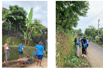
gambar 5 kerja bakti

Kegiatan kerja bakti dilaksanakan pada tanggal 3 Maret 2024 yang diikuti oleh mahasiswa KKN bersama masyarakat giriloyo, dengan tujuan dapat mempererat silaturahmi serta membuat lingkungan dusun giriloyo menjadi bersih. Mahasiswa menjadi penggerak adanya pelaksanaan kerja bakti serta Masyarakat ikut andil dalam penyediaan konsumsi. Namun dalam kegiatan ini memiliki beberapa kendala seperti keterbatasan alat-alat kebersihan sehingga proses kerja bakti kurang optimal. Sehingga hasil yang dicapai lingkungan dusun Giriloyo menjadi lebih bersih dan masyarakat menjadi nyaman dalam beraktifitas sehari-hari.