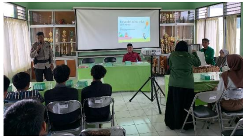
Gambar 4. Sosialisasi Permasalahan Remaja dan UU Pernikahan

3.3 Di kawasan RW 06 Kelurahan Pandeyan, terdapat potensi yang signifikan untuk pengembangan Usaha Mikro, Kecil, dan Menengah (UMKM) di sektor produksi tempe. Tempe adalah produk pangan tradisional Indonesia yang memiliki nilai gizi tinggi dan menjadi makanan pokok bagi sebagian besar masyarakat. Produksi tempe merupakan kegiatan ekonomi lokal yang dapat memberikan dampak positif pada perekonomian kawasan, serta mendukung keberlangsungan usaha mikro dan menengah. Selain itu, untuk mendukung produk UMKM lainnya, dibuat program pengabdian Sosialisasi Digital Marketing dan Pembukuan Laporan Keuangan UMKM yang bertujuan untuk meningkatkan pemahaman dan keterampilan pelaku Usaha Mikro, Kecil, dan Menengah (UMKM) dalam penerapan strategi pemasaran digital dan pembukuan laporan keuangan. Melalui kegiatan ini, diharapkan UMKM dapat memanfaatkan teknologi digital untuk memperluas jangkauan pasar dan meningkatkan efisiensi dalam manajemen keuangan mereka. Diharapkan program ini akan meningkatkan pengetahuan dan keterampilan pelaku UMKM dalam digital marketing dan pembukuan keuangan, sehingga mereka dapat mengelola usaha mereka dengan lebih efektif. Dengan menerapkan strategi pemasaran digital dan pembukuan keuangan yang efektif, diharapkan UMKM dapat meningkatkan efisiensi dalam operasional mereka dan meningkatkan produktivitas usaha. Narasumber dalam kegiatan ini adalah Bapak Rinaldi, S.T., MBA. selaku dosen fakultas ekonomi Universitas Cokroaminoto Yogyakarta.