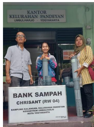
Gambar 2. Penyerahan Plang Papan Nama dan Losida

untuk mengajak warga agar disiplin dalam mengelola sampah organiknya. Kegiatan selanjutnya adalah dengan menyalurkan ember tumpuk dan losida sampah sebagai upaya untuk mengelola sampah secara lebih efektif di lingkungan masyarakat. Ember tumpuk merupakan alat pemroses pupuk yang dibuat dengan menyatukan 2 buah ember yang disusun bertingkat. Ember tumpuk digunakan untuk mengolah sampah dengan bantuan larva Hi ( Hermetia illucens ) pada skala rumah tangga. Hermetia illucens dikenal juga sebagai BSF ( Black Soldier Fly ) atau lalat tentara hitam. Losida yang merupakan singkatan lodong sisa dapur merupakan komposter sederhana yang bisa dibuat sendiri. Kompos yang dihasilkan pun bisa dimanfaatkan untuk media tanam. Penyaluran ember tumpuk dan losida sampah ini dilakukan sebagai solusi untuk mengurangi jumlah sampah yang terbuang begitu saja ke lingkungan, sehingga dapat membantu menjaga kebersihan lingkungan dan mengurangi dampak negatifnya. Pemberian Losida ini didukung oleh Pasti Angkut, berkerjasama dengan sebuah perusahaan digital yang menyediakan sistem layanan sampah paripurna berpengalaman sejak tahun 2013 yang berbasis di Condongcatur, Depok, Sleman, Yogyakarta. Sebagai bentuk dukungan dan memberikan dampak yang berkelanjutan, pengabdian juga dilakukan dengan memberi plang papan nama untuk 13 bank sampah yang ada di Kelurahan Pandeyan.