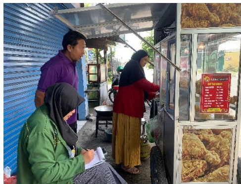
Gambar 5. Survei lokasi UMKM

Selain itu, dilakukan juga pengabdian berupa Konsultasi Layanan dan Pembuatan Sertifikat Halal yang bertujuan untuk memberikan layanan konsultasi kepada pelaku usaha mikro kecil menengah (UMKM) lokal setempat terkait dengan proses penerbitan sertifikat halal dan membantu dalam proses pembuatan sertifikat halal bagi produk-produk yang dihasilkan oleh UMKM. Melalui program ini, diharapkan UMKM dapat memperoleh pemahaman yang lebih baik mengenai proses sertifikasi halal dan meningkatkan kualitas produk mereka untuk memenuhi standar halal. Sesuai ketentuan Undang-undang Nomor 33 tahun 2014 tentang Jaminan Produk Halal (JPH), produk yang masuk, beredar dan diperdagangkan di wilayah Indonesia wajib bersertifikat halal. Kewajiban bersertifikat halal ini sesuai Peraturan Pemerintah Nomor 39 tahun 2021 tentang Penyelenggaraan Bidang Jaminan Produk Halal, diatur dengan penahapan di mana masa penahapan pertama kewajiban sertifikat halal akan berakhir 17 Oktober 2024. ( https://bpjph.halal.go.id/detail/produk-ini-harus-bersertifikat-halal-di-oktober-2024-bpjph-imbau-pelaku-usaha-segera-urus-sertifikasi-halal ) untuk itu pengabdian dilakukan untuk mengedukasikan alur pembuatan sehingga diharapkan setelah KKN berakhir pedagang lain tetap mampu mengurus sertifikasi halal untuk produknya. Program pengabdian ini sendiri sudah membantu dua pedagang lokal setempat (pengusaha fried chicken dan bakery ) menerbitkan sertifikat halal produknya.