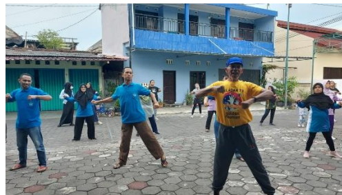
Gambar 10. Senam Sehat

3.7 Untuk meningkatkan gaya hidup masyarakat, program pengabdian selanjutnya dengan mendampingi warga dalam melaksanakan Senam Sehat yang rutin diadakan setiap minggu. Bertujuan untuk meningkatkan gaya hidup sehat melalui kegiatan senam sore oleh instruktur setempat, kegiatan senam dilaksanakan secara berkala di tempat yang strategis seperti lapangan terbuka depan masjid dan telah melibatkan partisipasi aktif dari seluruh lapisan masyarakat.