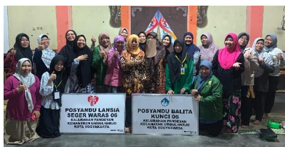
Gambar 8. Penyerahan Plang Posyandu

3.5 Program pengabdian selanjutnya adalah pendampingan posyandu balita dan posyandu lansia yang bertujuan untuk memberikan pendampingan dan dukungan kepada posyandu balita dan posyandu lansia di wilayah RW 06 dan RW 07 Sidikan, Pandeyan. Melalui program ini, pengabdi membantu dalam pelaksanaan kegiatan posyandu serta memberikan dukungan dalam pemantauan dan evaluasi perkembangan kesehatan balita dan lansia di lingkungan tersebut. Untuk manfaat jangka panjang diberikan dukungan fisik yang bertujuan untuk meningkatkan kualitas layanan kesehatan dengan cara memperbaiki infrastruktur, yaitu dengan pembuatan plang papan nama untuk Posyandu Balita dan Posyandu Lansia. Melalui pembuatan plang papan nama ini, diharapkan dapat mempermudah identifikasi dan akses masyarakat terhadap layanan kesehatan yang disediakan oleh Posyandu Balita dan Posyandu Lansia. Hal ini juga bertujuan untuk memberikan dukungan visual yang jelas dan mudah diakses bagi masyarakat, sehingga dapat meningkatkan partisipasi dalam program-program kesehatan yang diselenggarakan oleh Posyandu. Dengan demikian, diharapkan program ini dapat memberikan kontribusi dalam peningkatan kesehatan dan kesejahteraan masyarakat di wilayah tersebut.