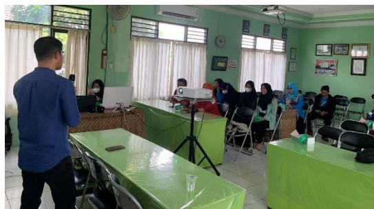
Gambar 5. Sosialisasi Digital Marketing dan Pembukuan UMKM

3.3 Di kawasan RW 06 Kelurahan Pandeyan, terdapat potensi yang signifikan untuk pengembangan Usaha Mikro, Kecil, dan Menengah (UMKM) di sektor produksi tempe. Tempe adalah produk pangan tradisional Indonesia yang memiliki nilai gizi tinggi dan menjadi makanan pokok bagi sebagian besar masyarakat. Produksi tempe merupakan kegiatan ekonomi lokal yang dapat memberikan dampak positif pada perekonomian kawasan, serta mendukung keberlangsungan usaha mikro dan menengah. Selain itu, untuk mendukung produk UMKM lainnya, dibuat program pengabdian Sosialisasi Digital Marketing dan Pembukuan Laporan Keuangan UMKM yang bertujuan untuk meningkatkan pemahaman dan keterampilan pelaku Usaha Mikro, Kecil, dan Menengah (UMKM) dalam penerapan strategi pemasaran digital dan pembukuan laporan keuangan. Melalui kegiatan ini, diharapkan UMKM dapat memanfaatkan teknologi digital untuk memperluas jangkauan pasar dan meningkatkan efisiensi dalam manajemen keuangan mereka. Diharapkan program ini akan meningkatkan pengetahuan dan keterampilan pelaku UMKM dalam digital marketing dan pembukuan keuangan, sehingga mereka dapat mengelola usaha mereka dengan lebih efektif. Dengan menerapkan strategi pemasaran digital dan pembukuan keuangan yang efektif, diharapkan UMKM dapat meningkatkan efisiensi dalam operasional mereka dan meningkatkan produktivitas usaha. Narasumber dalam kegiatan ini adalah Bapak Rinaldi, S.T., MBA. selaku dosen fakultas ekonomi Universitas Cokroaminoto Yogyakarta.