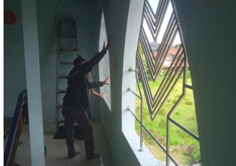
Gambar 9. Perbaikan Jendela & Pintu

Perbaikan ini merupakan bagian dari program pemberdayaan masjid yang bertujuan untuk menjaga serta meningkatkan fungsi dan estetika masjid sebagai pusat kegiatan keagamaan dan sosial di masyarakat.