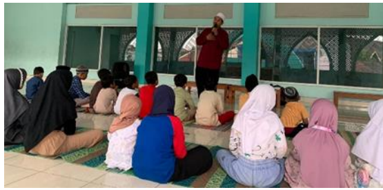
Gambar 7. Pengajian Anak-Anak

3.5 Program pengabdian selanjutnya adalah pendampingan posyandu balita dan posyandu lansia yang bertujuan untuk memberikan pendampingan dan dukungan kepada posyandu balita dan posyandu lansia di wilayah RW 06 dan RW 07 Sidikan, Pandeyan. Melalui program ini, pengabdi membantu dalam pelaksanaan kegiatan posyandu serta memberikan dukungan dalam pemantauan dan evaluasi perkembangan kesehatan balita dan lansia di lingkungan tersebut. Untuk manfaat jangka panjang diberikan dukungan fisik yang bertujuan untuk meningkatkan kualitas layanan kesehatan dengan cara memperbaiki infrastruktur, yaitu dengan pembuatan plang papan nama untuk Posyandu Balita dan Posyandu Lansia. Melalui pembuatan plang papan nama ini, diharapkan dapat mempermudah identifikasi dan akses masyarakat terhadap layanan kesehatan yang disediakan oleh Posyandu Balita dan Posyandu Lansia. Hal ini juga bertujuan untuk memberikan dukungan visual yang jelas dan mudah diakses bagi masyarakat, sehingga dapat meningkatkan partisipasi dalam program-program kesehatan yang diselenggarakan oleh Posyandu. Dengan demikian, diharapkan program ini dapat memberikan kontribusi dalam peningkatan kesehatan dan kesejahteraan masyarakat di wilayah tersebut.