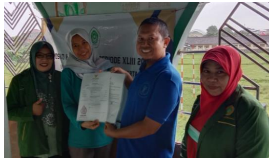
Gambar 6. Penyerahan Sertifikat Halal