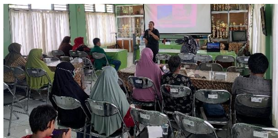
Gambar 3. Sosialisasi Pengelolaan Sampah