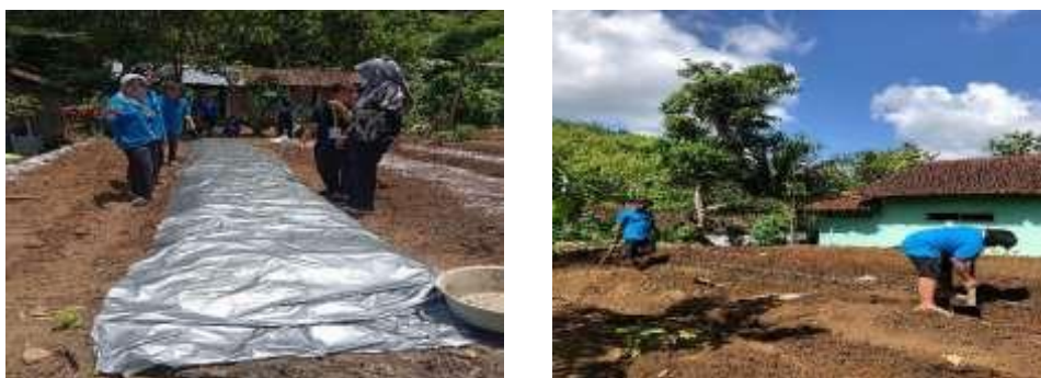
Gambar 4. Pengelolaan Jalan