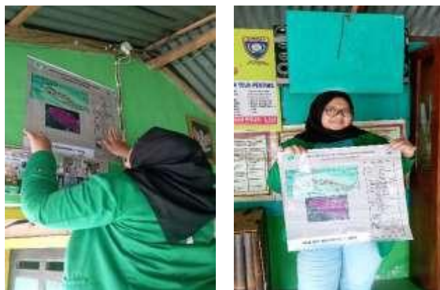
Gambar 6. Pemetaan Denah UMKM Des