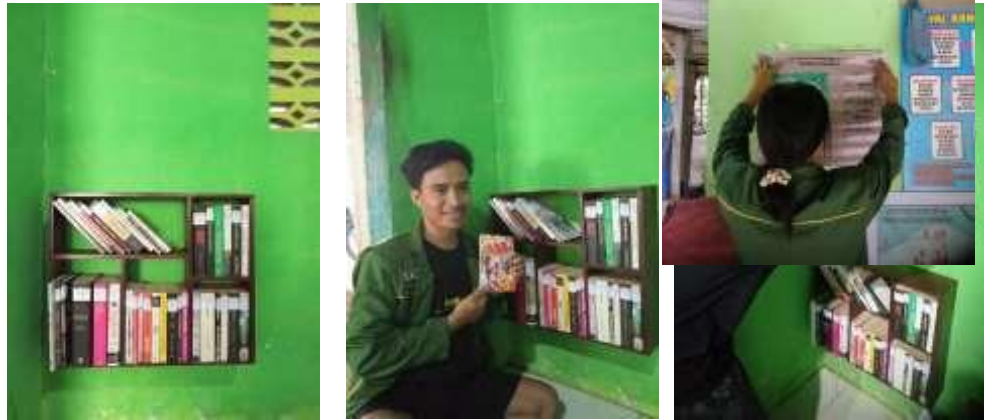
Gambar 5. Pengadaan Pojok Baca Mini