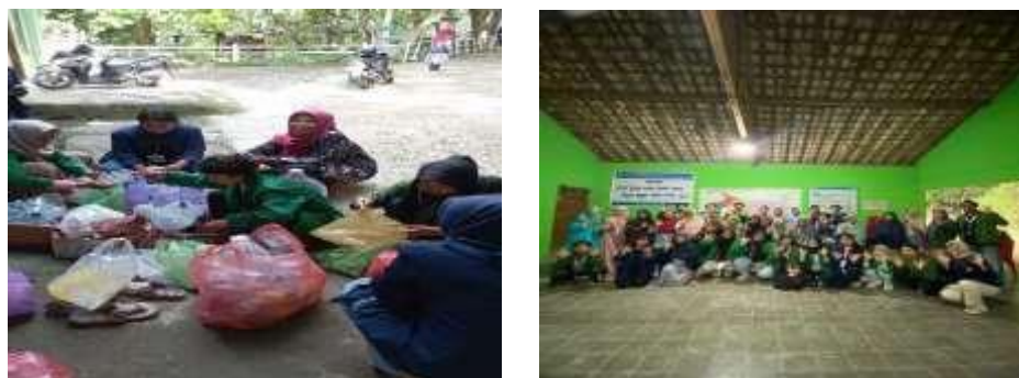
Gambar 9. Pengelolaan Saph.