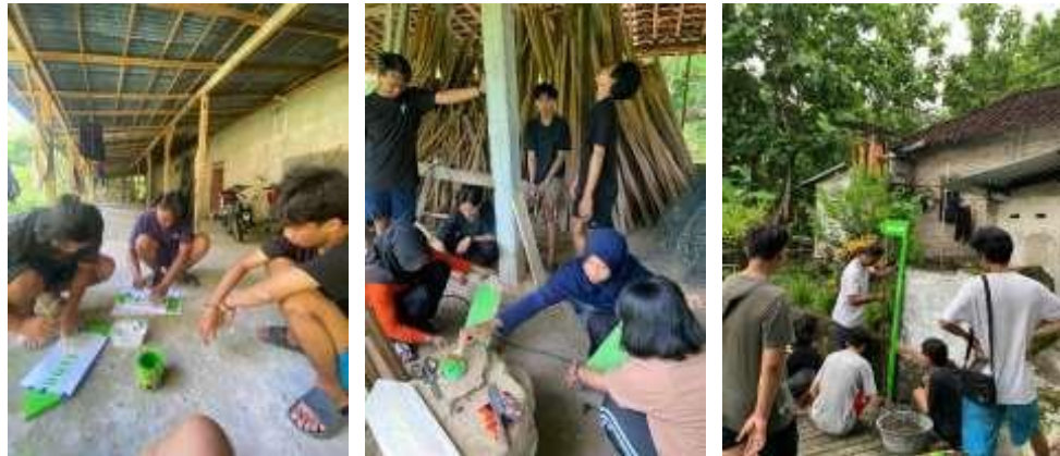
Gambar 2. Pembuatan Plang Jalan