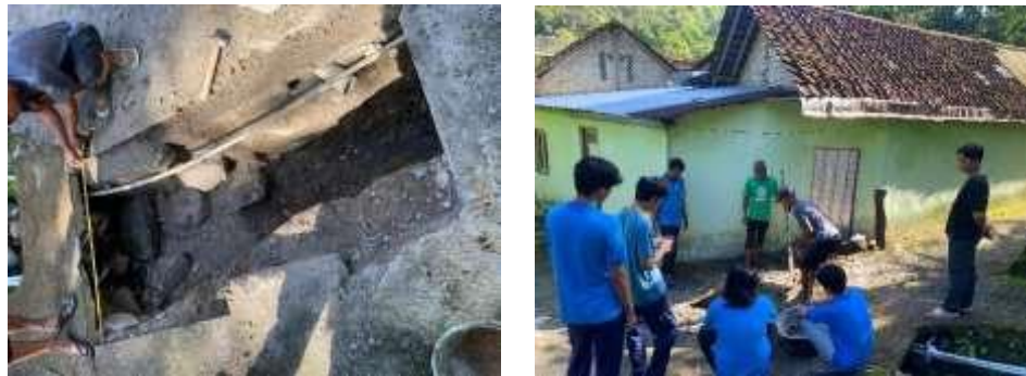
Gambar 3. Perbaikan Jalan

Jalan yang digunakan aktivitas RT 01 sudah diperbaiki dan bisa digunakan aktivitas lagi.