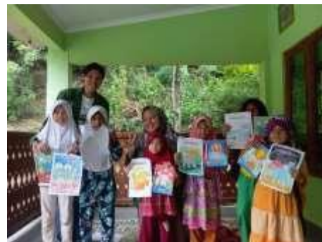
Gambar 7. BIMBEL (Bimbingan Belajar)