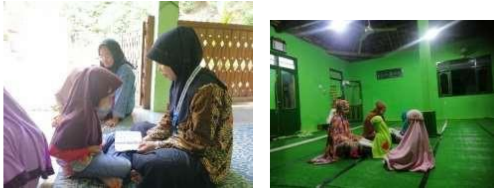
Gambar 8. (Taman Pendidikan Al- Qur'an)