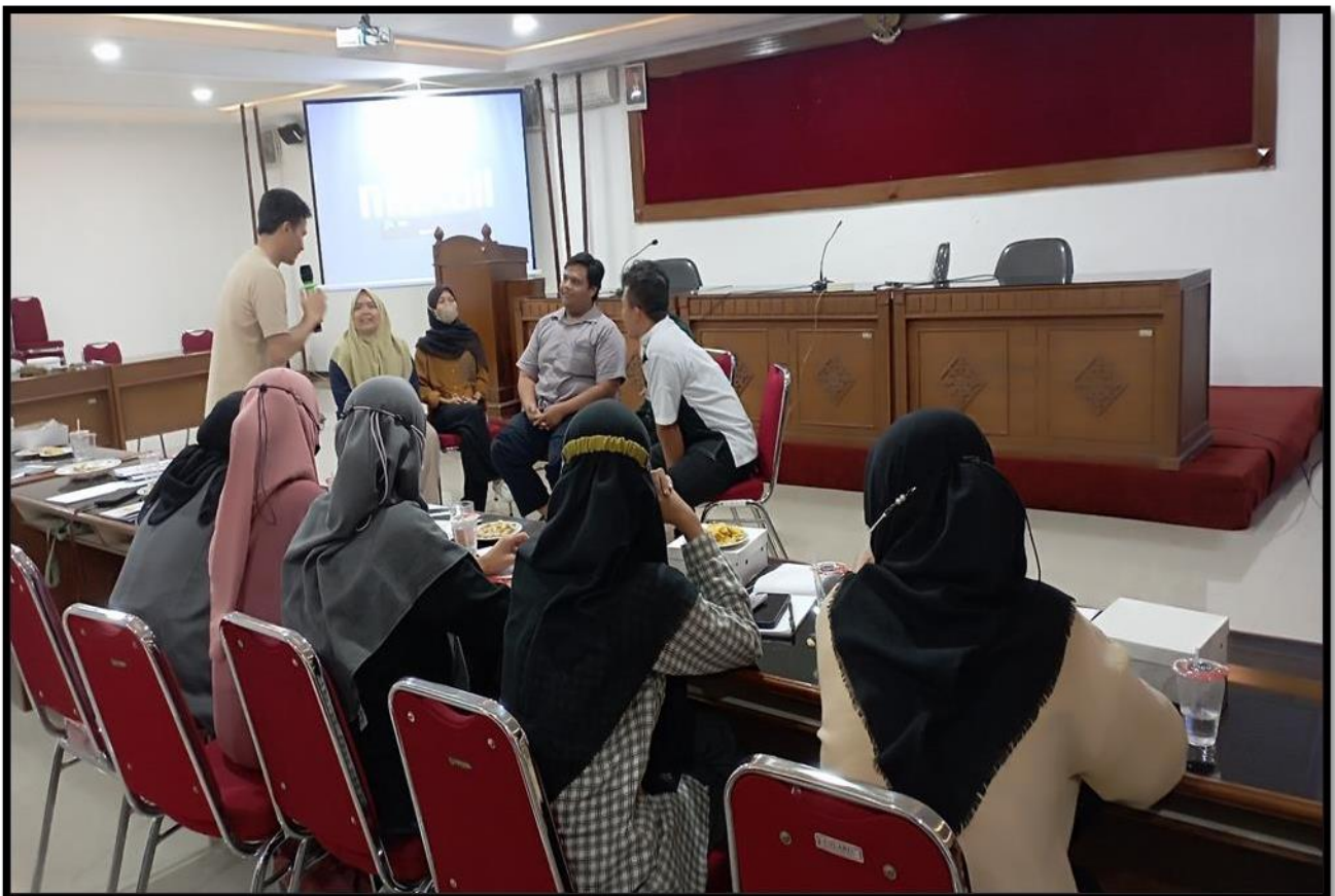
Gambar 2. Praktik Pembelajaran Orang Dewasa dan Pengelolaan Kelas

Adapun dokumentasi pelaksanaan kegiatan ini sebagaimana dapat dilihat pada beberapa gambar berikut.