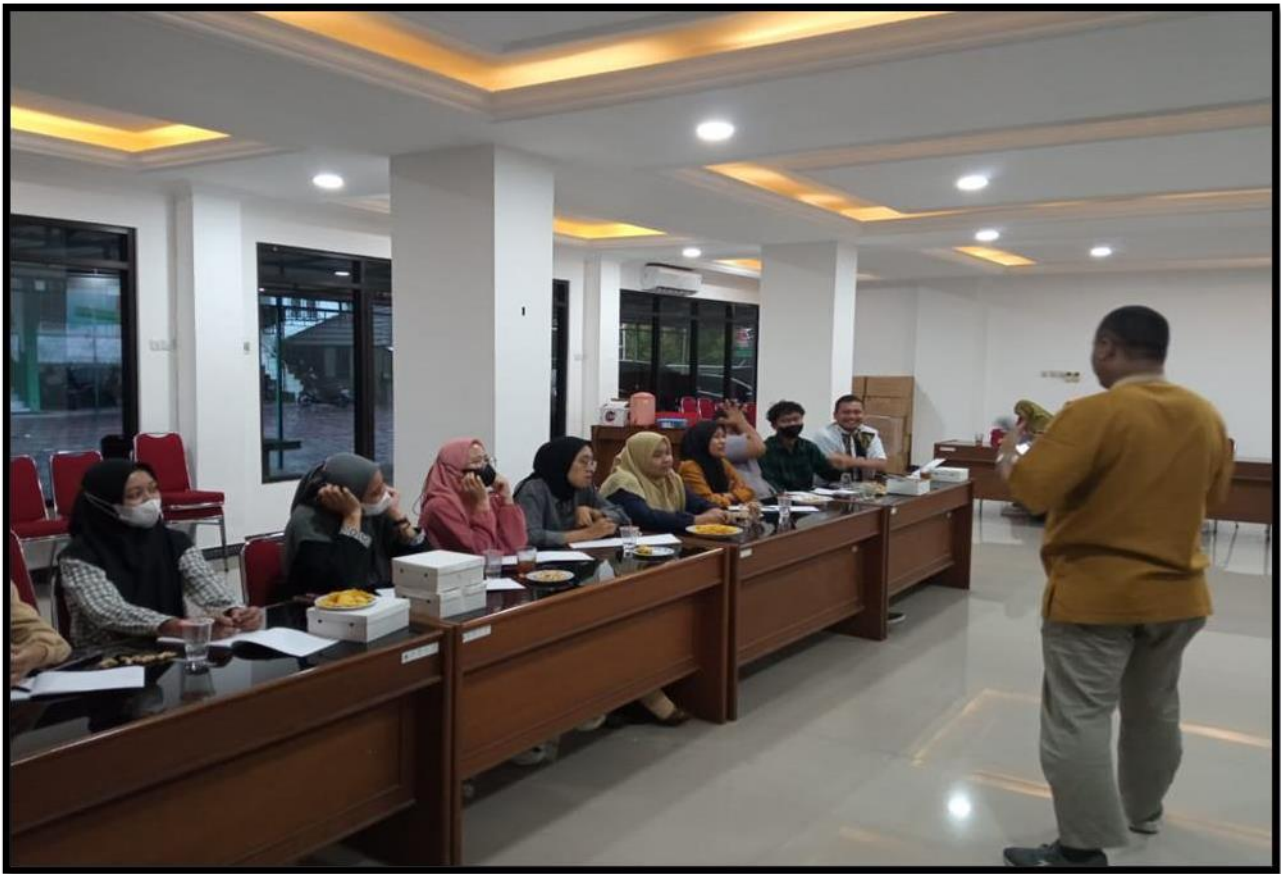
Gambar 3. Pemberian Materi dan Penutupan Kegiatan