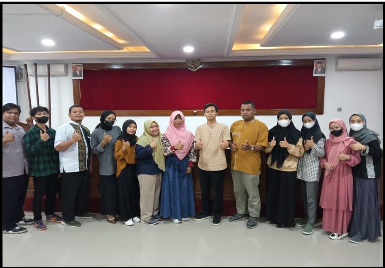
Gambar 3. Foto Bersama Kegiatan Penutup Pelatihan