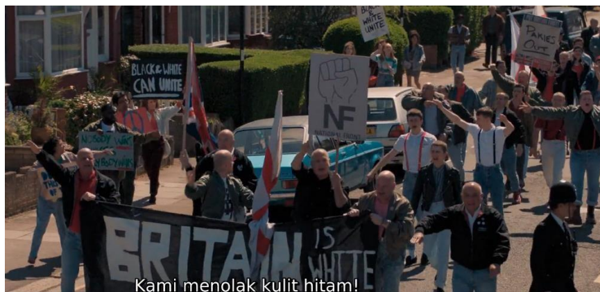
Gambar 3. Diskriminasi pada Film Blinded By The Light

Masjid yang merupakan tempat ibadah umat Islam pun tidak lepas menjadi sasaran diskriminasi ini, terjadi penolakan dengan cara melempar kepala babi agar masjid segera ditutup. Diskriminasi dan ancaman ini terjadi secara terorganisir dilakukan oleh kelompok National Front (NF) dengan mencoret rumah orang-orang Pakistan dengan tulisan “Pakies Out” dan “Pakies Go Home” yang artinya pulanglah orang-orang Pakistan. Diskriminasi ini tidak hanya menasar orang-orang Pakistan tapi juga orang-orang kulit hitam dengan slogan “Britain is White” yang artinya Inggris adalah Putih dan ditunjukkan pada demo besar-besaran oleh NF hingga terjadi tindakan anarkis dengan menganiaya orang-orang Pakistan yang melintas saat demo tersebut berjalan. Landasan NF melakukan tindakan ini didasari oleh paham fasisme Nazi yang menganggap bahwa kulit putih adalah ras tertinggi sehingga tidak bisa hidup berdampingan dengan ras dan warna kulit yang lain.