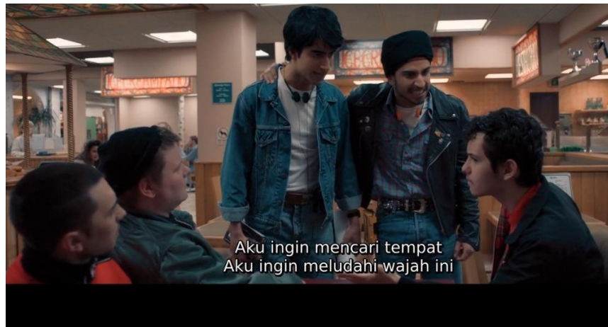
Gambar 4. Solidaritas dan Perlawanan pada Film Blinded By The Light