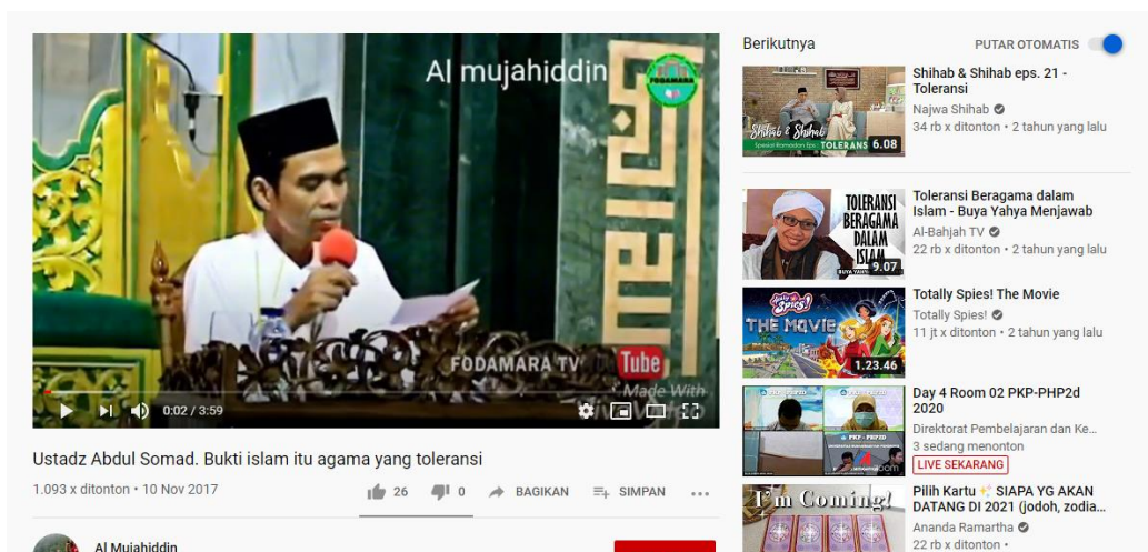
Gambar 2. SC Salah satu video dakwah islam dengan tema toleransi

Toleransi berarti sifat atau sikap toleran. Dalam pendidikan karakter toleransi berarti sikap dan tindakan yang menghargai perbedaan agama, suku, etnis, pendapat, sikap dan tindakan orang lain yang berbeda dari dirinya. Di dalam platform Youtube dakwah islam yang merepresentasikan nilai toleransi adalah dakwah dari Ust. Abdul Somad yang berjudul “Toleransi Antar Umat Beragama” di channel Hidayah Chanel dan “Toleransi” di channel Agama Sempurna yang telah ditonton 1900 kali. Kedua video dakwah islam tersebut membahas tentang apa itu toleransi, dan bagaimana batas-batas toleransi antar umat beragama. Kedua video dakwah islam tersebut secara tidak langsung mengajarkan kepada masyarakat khususnya umat islam tentang bagaimana bersikap toleransi kepada sesama manusia dan antar umat beragama, sehingga video dakwah islam tersebut di atas secara tidak langsung mengajarkan nilai pendidikan karakter kepada masyarakat khususnya yang menonton video ceramah Ust. Abdul Somad tersebut.