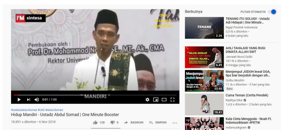
Gambar 5. SC Salah satu video dakwah islam dengan tema mandiri

Mandiri adalah keadaan seseorang yang tidak bergantung pada orang lain. Pada pendidikan karakter, mandiri berarti sikap dan perilaku yang tidak mudah tergantung pada orang lain dalam menyelesaikan tugas-tugas. Di media sosial Youtube dakeah Islam yang membahas tentan kemandirian terdapat dalam dakwah yang berjudul “Hidup Mandiri” oleh Ust. Abdul Somad di channel Medsos Dakwah. Dakwah tersebut membahas tentang bagaimana seharusnya umat islam harus dapat hidup mandiri dan tidak terlalu mudah tergantung pada orang lain. Di dalam dakwah tersebut juga dijelaskan jika Allah Swt. menyukai hambanya yang memiliki sifat mandiri. Oleh karena itu, dakwah islam tersebut merepresentasikan nilai pendidikan karakter berupa kemandirian.