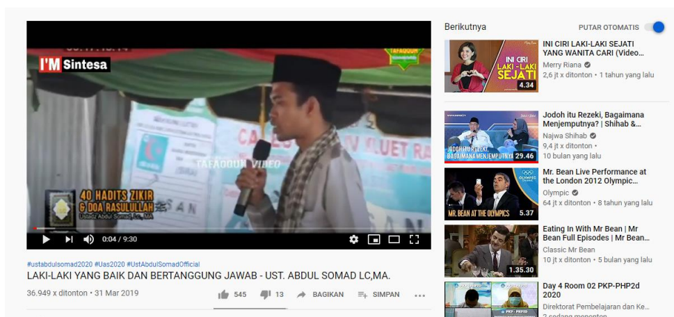
Gambar 8. SC Salah satu video dakwah islam dengan tema tanggung jawab

Tanggung jawab dalam pendidikan karakter berarti sikap dan perilaku seseorang untuk melaksanakan tugas dan kewajibannya yang seharusnya dia lakukan terhadap diri sendiri, masyarakat, lingkungan (alam, sosial dan budaya), negara dan Tuhan Yang Maha Esa. Di media sosial Youtube nilai tanggung jawab terlihat pada dakwah Islam yang berjudul "Tanggung Jawab" oleh Ust. Abdul Somad di channel Suaramuslim TV dan telah ditonton 3600 kali. Serta dakwah yang berjudul "Laki-laki yang Baik dan Bertanggung Jawab" di channel Jemaah UAS yang telah ditonton 36 ribu kali. Dakwah yang berjudul "Tanggung Jawab" secara umum menjelaskan tentang ruang lingkup tanggung jawab dalam kehidupan sehari-hari bagi umat muslim, sedangkan dakwah yang berjudul "Laki-laki yang Baik dan Bertanggung Jawab" menjelaskan tentang kriteria laki-laki yang baik dan bertanggung jawab dalam Islam. Kedua video dakwah Islam tersebut secara tidak langsung mengajarkan kepada masyarakat khususnya umat muslim tentang sikap tanggung jawab yang termasuk dalam nilai pendidikan karakter.