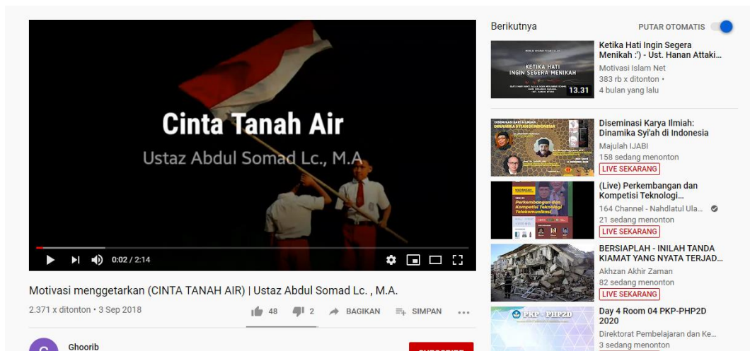
Gambar 6. SC Salah satu video dakwah islam dengan tema cinta tanah air

Dalam pendidikan karakter, cinta tanah air berarti cara berpikir, bertindak, dan berwawasan yang menempatkan kepentingan bangsa dan bernegara di atas kepentingan diri dan kelompoknya. Di media sosial Youtube , video dakwah yang merepresentasikan nilai cinta tanah air terdapat dalam dakwah Islam yang berjudul “Cinta Tanah Air” oleh Ust. Abdul Somad di channel Ghoorib yang telah ditonton 2200 kali. Serta dakwah yang berjudul “Memupuk Rasa Cinta Tanah Air sebagai Pemuda Muslim” di channel Medsos Dakwah. Kedua video dakwah tersebut membahas tentang apa itu cinta tanah air dalam Islam, serta bagaimana menumbuhkan rasa cinta tanah air dalam diri khususnya menumbuhkan rasa cinta tanah air di kalangan pemuda. Kedua video dakwah tersebut di atas menunjukkan bahwa dakwah Islam juga telah mengangkat tema-tema pembahasan yang mendukung pendidikan karakter.