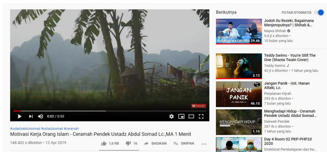
Gambar 4. SC Salah satu video dakwah islam dengan tema kerja keras

membangkitkan Semangat Kerja” dan “Motivasi Kerja Orang Islam” membahas tentang semangat kerja keras dalam islam, bagaimana cara membangkitkan semangat kerja, serta cara membentuk kebiasaan kerja keras dalam diri. Oleh karena itu, dakwah Islam di channel Dakwah Islamiyah dan Dakwah Pendek tersebut merepresentasikan nilai-nilai kerja keras.