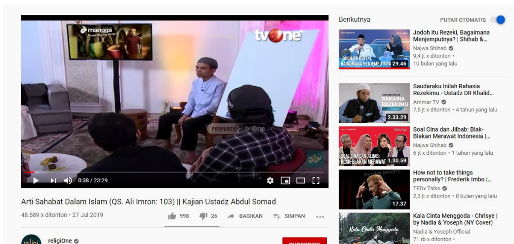
Gambar 7. SC Salah satu video dakwah islam dengan tema bersahabat