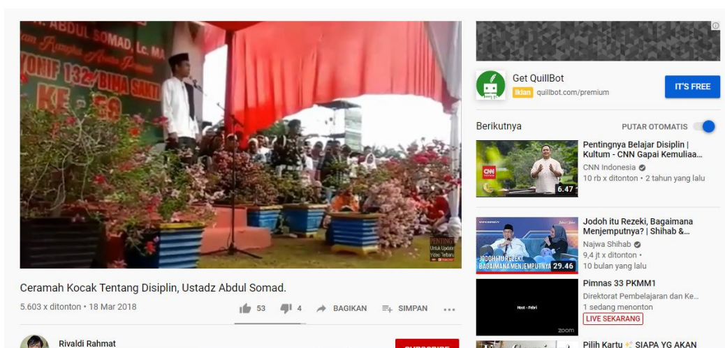
Gambar 3. SC Salah satu video dakwah islam dengan tema disiplin

Disiplin merupakan sikap ketaatan atau kepatuhan terhadap tata tertib dan sebagainya. Dalam pendidikan karakter disiplin berarti tindakan yang menunjukkan perilaku tertib dan patuh pada berbagai ketentuan dan peraturan. Di media sosial Youtube dakwah Islam yang merepresentasikan nilai kedisiplinan terdapat dalam dakwah Ust. Abdul Somad yang berjudul “Tentang Disiplin” di channel Rivaldi Rahmat yang telah ditonton 5500 kali, serta video yang berjudul “Pentingnya disiplin dalam Waktu” di channel Parsilaungan. Pada dakwah yang berjudul “Tentang Disiplin” Ust. Abdul Somad menghimbau kepada umat muslim untuk selalu berdisiplin dalam segala hal, mulai disiplin dalam pekerjaan, disiplin dalam bekerja, serta berdisiplin dalam segala aktivitas sehari-hari. Pada dakwah yang berjudul “Pentingnya Disiplin dalam Waktu” Ust. Abdul Somad menghimbau para jemaahnya untuk disiplin dalam memanfaatkan waktu karena waktu tidak dapat kembali lagi sehingga harus dimanfaatkan dengan efisien. Dari kedua dakwah Islam tersebut terlihat bahwa terdapat representasi nilai kedisiplinan dalam dakwah tersebut.