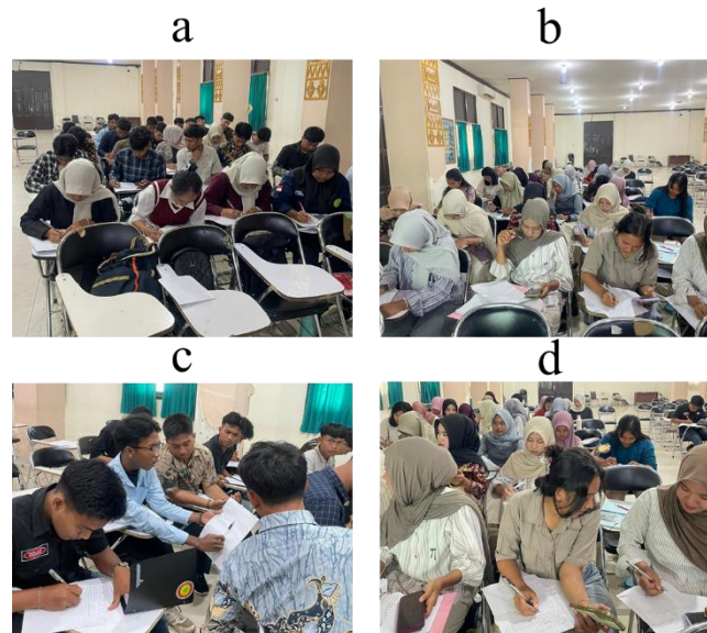
Gambar 1. Aktivitas mahasiswa dalam pelaksanaan metode peer review : (a) pemberian materi oleh dosen; (b) mahasiswa menulis paragraf; (c) diskusi hasil peer review ; dan (d) penulisan ulang paragraf untuk perbaikan.

Selama proses berlangsung, hasil observasi menunjukkan bahwa mahasiswa tampak aktif membaca, menilai, dan mendiskusikan tulisan teman ditunjukkan pada Gambar 1 . Mahasiswa juga menunjukkan sikap lebih teliti dan kritis dalam mengidentifikasi kesalahan.