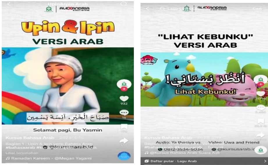
الشكل 2. محتوى "تعلم اللغة العربية من الرسوم المتحركة"

سيساعد استخدام وسائل التواصل الاجتماعي على زيادة حماس الطلاب في تعلم اللغات الأجنبية، وخاصة اللغة العربية. بشكل عام، تحتوي وسائط التعلم على أنواع مختلفة من المعلومات والمعرفة، والتي تهدف إلى دعم أنشطة التعلم (Karami et al., 2021b). تتضمن مقاطع فيديو الرسوم المتحركة Tik Tok و youtube وسائط سمعية وبصرية. لذلك فهي قادرة جدا على استخدامها كوسيلة تعليمية ممتعة وليست مملة (Handayani., 2022).