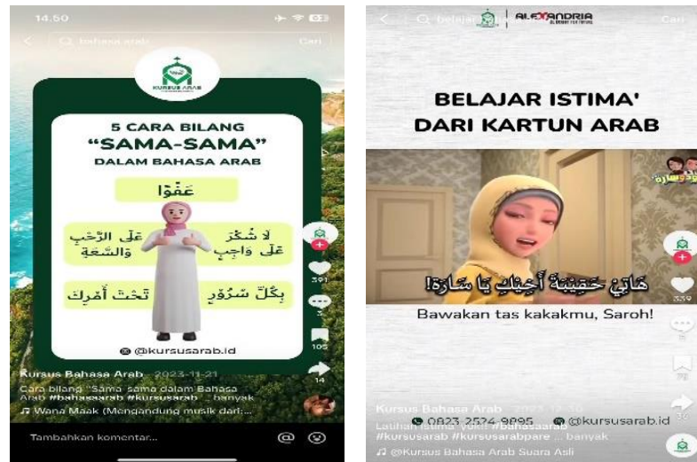
الشكل 4. محتوى تعلم القراءة والاستماع من الرسوم الكاريكاتورية العربية

يحتوي الفيديو التالي على مفردات لإدخال مختلف المهن والتعبيرات اليومية باللغة العربية. يمكن أن يساعد ذلك الأطفال على تعلم اللغة العربية منذ سن مبكرة وتدريب مهاراتهم الحركية على الحفظ، بما في ذلك الأشخاص الذين كبروا يمكنهم أيضا التعلم باستخدام الفيديو من خلال النظر إلى الصور الموجودة في الشرائح التي يتم غناؤها، بالإضافة إلى عرض الكتابة العربية ومعناها.