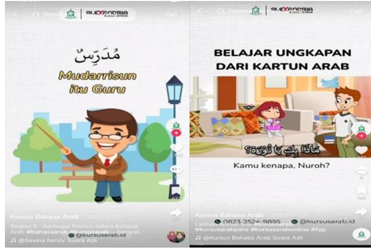
الشكل 3. مقدمة احترافية محتوى تعليمي