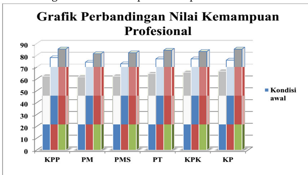
Gambar 2 Perbandingan Hasil Ketercapaian Kompetensi

Dengan melihat perbandingan hasil pada siklus I dan siklus II ada peningkatan yang cukup signifikan, baik dilihat dari peningkatan minat guru maupun hasil perolehan rata-rata kemampuan guru dalam meningkatkan kinerja. Dari sejumlah dua belas guru semua telah mencapai peningkatan, hal ini menunjukkan bahwa pelaksanaan DIA secara efektif dapat