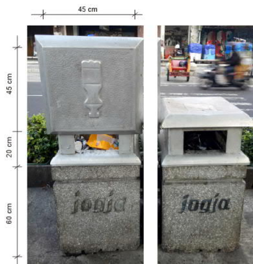
Gambar 6 Tempat sampah di pedestrian Jalan Malioboro dengan kondisi penutup sampah terbuka (kiri), dan kondisi penutup sampah tertutup (kanan)

Pengelolaan sampah adalah kegiatan yang sistematis, menyeluruh, dan berkesinambungan yang meliputi pengurangan dan penanganan sampah. Sumber sampah di wilayah studi adalah timbulan sampah berupa sampah organik maupun anorganik yang berasal dari aktivitas PKL maupun dari aktivitas pengunjung. Sampah di sekitar wilayah studi termasuk sampah sejenis sampah rumah tangga karena sebagian besar berupa limbah makanan/minuman dan sampah kemasan makanan/minuman.