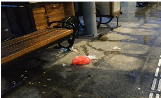
Gambar 1 sampah di sekitar tempat duduk pengunjung

Berdasarkan pengamatan di wilayah studi, sebaran sampah diantara terletak di beberapa tempat yakni: sekitar lapak pedagang PKL, di tempat duduk pengunjung, di sekitar tempat sampah, di lubang tanaman, serta di pedestrian.