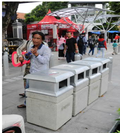
Gambar 4 Tempat Sampah di pedestrian Jl.Malioboro saat awal diresmikan

Kondisi tempat sampah di wilayah studi beberapa diantaranya sudah tidak ada penutupnya, Selain itu perilaku para pengunjung dan pengguna tempat sampah juga belum tertib memasukkan sampah sesuai dengan peruntukan jenisnya, sehingga sampah tercampur dalam satu tempat (organik dan anorganik). Tempat sampah berjejer setidaknya dua tempat sampah di setiap titik dengan jarak tertentu antar titiknya. Di sisi atas penutup tempat sampah terdapat simbol diantaranya simbol botol, kemasan minuman kotak, dan simbol " not recyclable ". Simbol-simbol ini memang kurang lazim digunakan untuk menunjukkan jenis sampah yang harus diwadahi di tempat yang dimaksud. Selain itu, letak simbol yang tertera di atas penutup tempat sampah juga kurang eye catching sehingga tidak mudah dilihat oleh pengunjung yang terkadang membuang sampah sambil berjalan.