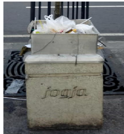
Gambar 5 Kondisi beberapa tempat sampah di pedestrian Jl.Malioboro yang sudah tidak berpenutup