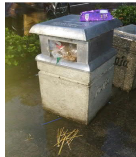
Gambar 2 sampah di sekitar tempat sampah yang tersedia di pedestrian